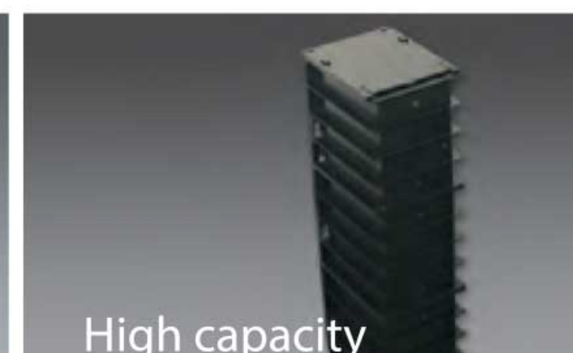
High capacity input hopper