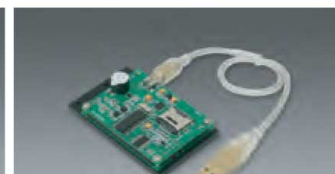
Contactless encoding module