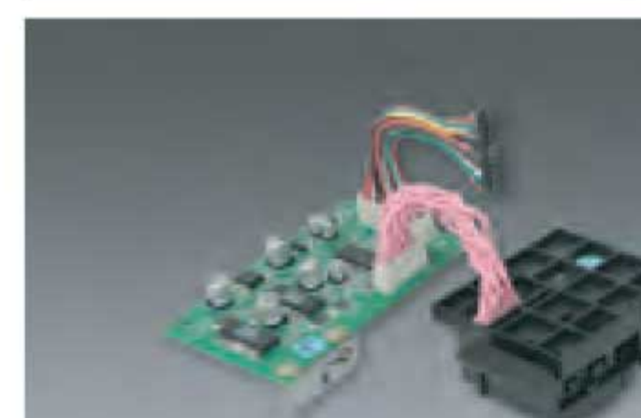
Magnetic stripe card encoding module