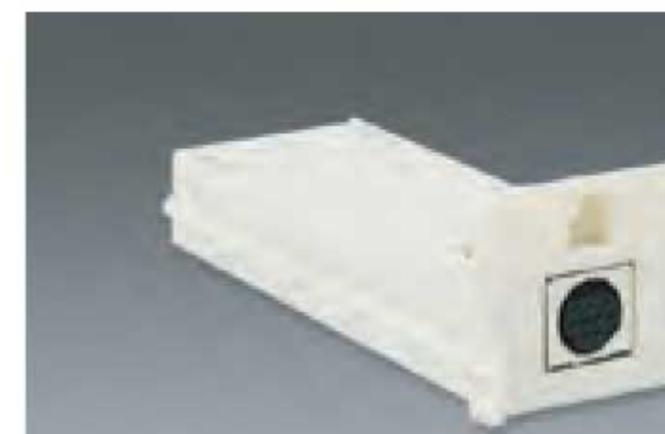
Contact Smart IC chip encoding module