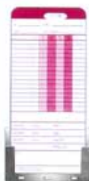
โถงบัตร กระดาษ