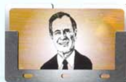
โถงบัตร พลาตติกยูทอนันต์